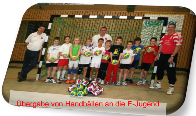
Übergabe von Handbällen an die E-Jugend

Wir suchen engagierte Fans aller Altersgruppen, die sich vor allem für den Handballsport interessieren und mit uns die Leutershausener Mannschaften unterstützen möchten. Über eigene Anregungen und Ideen freuen wir uns.